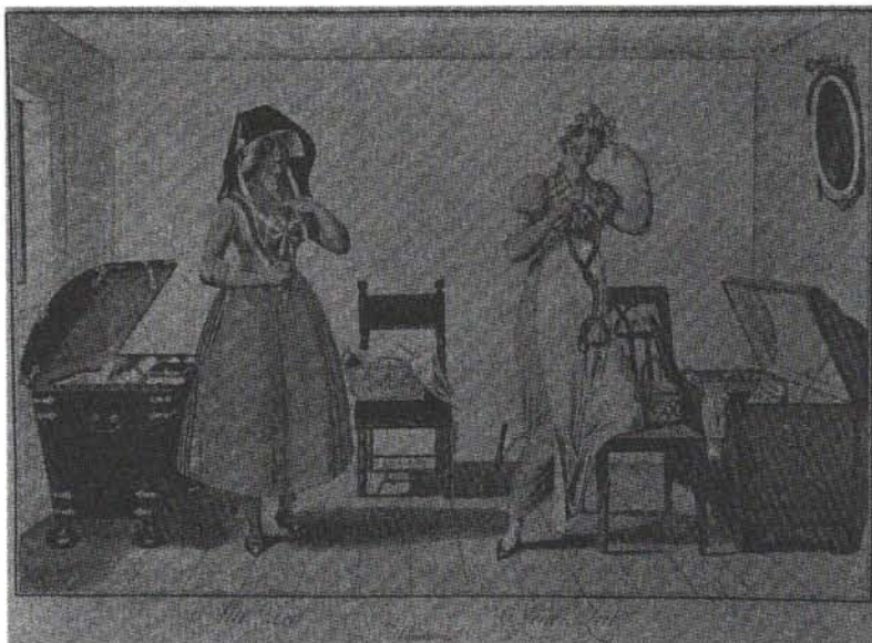
Abb. 1: Hamburger Dienstmädchen Einst und Jetzt. Handkolorierte Radierung, Hamburg 1808, in: Wolfgang Brückner, Populäre Druckgraphik Europas. Deutschland vom 15. bis zum 20. Jahrhundert, München 1969, Abb. 141.

Die neuen Lesegewohnheiten setzten sich vermutlich langsamer durch, als es die Wahrnehmungen der Zeitgenossen uns wissen lassen wollen. Die Diskussion um die „Lesesucht“ – „Alles liest Romane, bis auf den niedrigsten Stand im Publikum.“ 5 – vermittelt den Anschein, als hätten ganze Staaten und hierbei vorzüglich dessen weibliche Bevölkerung ab dem späten 18. Jahrhundert nur mehr Romane gelesen. So wurde denn mit Recht festgestellt, daß diese Klagen über die Lesesucht eine „ideologische Fälschung“ darstellten. So rasant, meinte Schenda, sei der Lesekonsum nicht gestiegen. 6 So stellt sich denn auch die Frage nach einer möglichen „Wut“ des Lesens traditioneller Literatur.